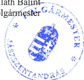
Kolláth Bálint polgármester