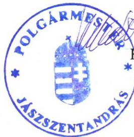
Kolláth Bálint polgármester